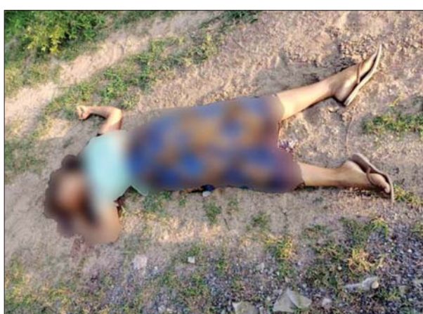
PDF အမည်ခံ အကြမ်းဖက်သမားများက သားဖွားဆရာမတစ်ဦးအား ဖမ်းဆီးခေါ်ဆောင်သတ်ဖြတ်ခဲ့သည့် မှတ်တမ်းဓာတ်ပုံ။

နေပြည်တော် ဇွန် ၇ စစ်ကိုင်း တိုင်းဒေသကြီး စစ်ကိုင်းမြို့နယ်၌ ဒေသခံပြည်သူများအား ဆေးဝါးကုသပေးလျက်ရှိသည့် ကျေးလက်ကျန်းမာရေးဌာနမှ သားဖွားဆရာမတစ်ဦးကို PDF အမည်ခံ အကြမ်းဖက်သမားများက ဖမ်းဆီးခေါ်ဆောင်သတ်ဖြတ်သွားခဲ့ကြောင်း သိရသည်။