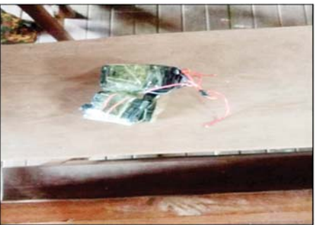
စစ်ကိုင်းတိုင်းဒေသကြီး မုံရွာမြို့နယ် အခြေခံပညာအလယ်တန်းကျောင်းအနီး အမှိုက်ပုံညံ့ အသံဗုံး တစ်လုံးပေါက်ကွဲမှု မှတ်တမ်းဓာတ်ပုံ။