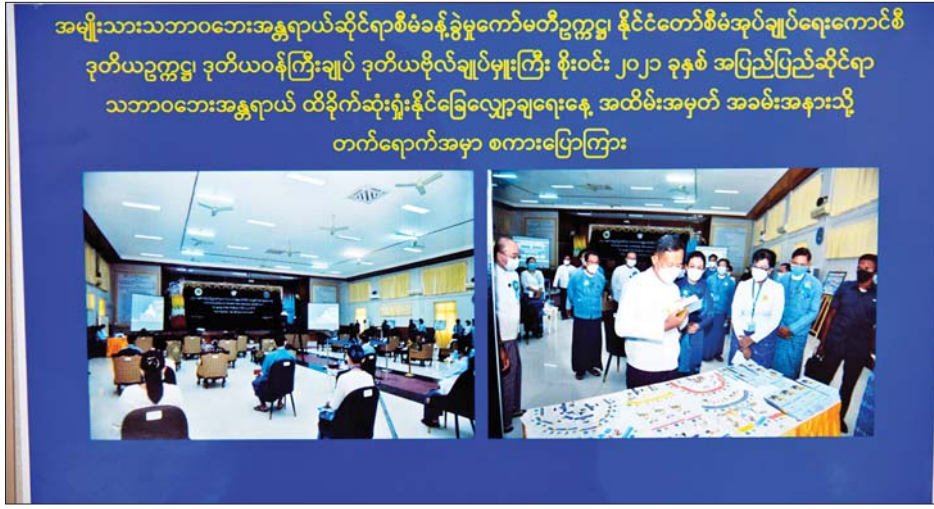
အမျိုးသားသဘာဝဘေးအန္တရာယ်ဆိုင်ရာစီမံခန့်ခွဲမှုကော်မတီဥက္ကဋ္ဌ နိုင်ငံတော်စီမံအုပ်ချုပ်ရေးကောင်စီ ဒုတိယဥက္ကဋ္ဌ ဒုတိယဝန်ကြီးချုပ် ဒုတိယဗိုလ်ချုပ်မှူးကြီး စိုးဝင်း ၂၀၂၁ ခုနှစ် အပြည်ပြည်ဆိုင်ရာ သဘာဝဘေးအန္တရာယ် ထိခိုက်ဆုံးရှုံးနိုင်ခြေလျှော့ချရေးနေ့ အထိမ်းအမှတ် အခမ်းအနားသို့ တက်ရောက်အမှာ စကားပြောကြား

Voice of Myanmar သတင်းဌာနမှ သတင်းထောက် ဦးမောင်မောင်ထွန်းက KNU အဖွဲ့မှ ငြိမ်းချမ်းရေးနှင့်ပတ်သက်ပြီး တက်လိုသည့်အဖွဲ့၊ မတက်လိုသည့်အဖွဲ့ဟု သဘောထားကွဲလွဲနေသည်ဟု ကြားသိရကြောင်း၊ ယင်းကိစ္စပေါ်တွင် KNU ဥက္ကဋ္ဌအနေဖြင့် ကျန်သည့်အဖွဲ့ဝင်များနှင့်လည်း အငြင်းပွားမှုများရှိသည်ဟု ကြားသိရကြောင်း၊ KNU က တက်ရောက်မည့်သူများရှိသည်ဟု ကြားသိရသည့်အတွက် နိုင်ငံတော်စီမံအုပ်ချုပ်ရေးကောင်စီ၏