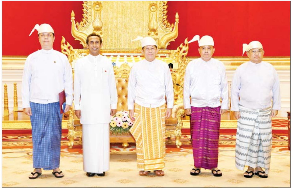
နိုင်ငံတော်စီမံအုပ်ချုပ်ရေးကောင်စီ ဥက္ကဋ္ဌ နိုင်ငံတော်ဝန်ကြီးချုပ် ဗိုလ်ချုပ်မှူးကြီး မင်းအောင်လှိုင်၊ မြန်မာနိုင်ငံဆိုင်ရာ သီရိလင်္ကာနိုင်ငံ သံအမတ်ကြီး H.E. Mr. J. M. Janaka Priyantha Bandara နှင့် တာဝန်ရှိသူများ စုပေါင်းမှတ်တမ်းတင် ဓာတ်ပုံရိုက်စဉ်။

ရှေ့ပုံးမှ နှစ်နိုင်ငံ နိုင်ငံရေးပြုပြင်ပြောင်းလဲမှုအခြေအနေများကို ရင်းရင်းနှီးနှီး ဆွေးနွေးခဲ့ကြသည်။ တွေ့ဆုံပွဲအပြီးတွင် နိုင်ငံတော်စီမံအုပ်ချုပ်ရေးကောင်စီဥက္ကဋ္ဌ ရေးမှူး ဒုတိယဗိုလ်ချုပ်ကြီး ရဲဝင်းဦး၊ နိုင်ငံခြားရေးဝန်ကြီးဌာန သတင်းစဉ်