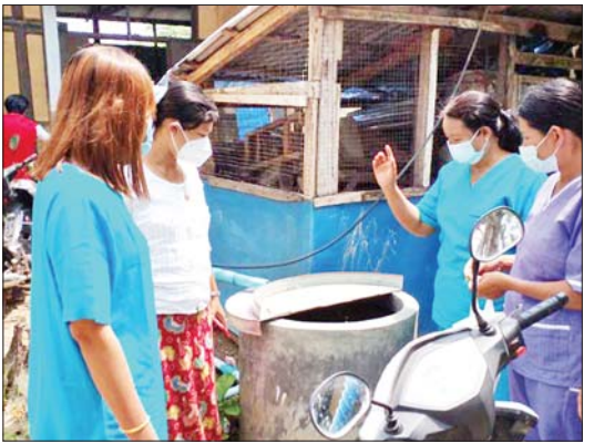
ပေးခြင်း၊ အတိတ်ဆေးများခတ်ခြင်း၊ ၁၅ နှစ်အောက် ကလေးများ၏ ဖျားနာမှုအခြေအနေနှင့် သွေးလွန်တုပ်ကွေးသံသယ လက္ခဏာများ ရှိ၊ မရှိ စစ်ဆေးခြင်းလုပ်ငန်းများကို ပူးပေါင်းဆောင်ရွက်ခဲ့ကြောင်း သိရသည်။

ထိုသို့ဆောင်ရွက်ရာ၌ အဆိုပါရပ်ကွက်များရှိ သွေးလွန်တုပ်ကွေးဖြစ်ပွားသူ သုံးဦး၏ ပတ်ဝန်းကျင်ရှိ နေအိမ် ၁၂၈ အိမ်နှင့် လူဦးရေ ၆၄၈ ဦးတို့တွင် သွေးလွန်တုပ်ကွေးရောဂါ ကြိုတင် ကာကွယ်ရေးနှင့်ပတ်သက်၍ ကျန်းမာရေးအသိပညာ ပေးခြင်း၊ ကျန်းမာရေးလက်ကမ်းစာစောင်များ ဝေငှခြင်း၊ မိမိတို့နေအိမ်ပတ်ဝန်းကျင်အတွင်း ဖုံး၊ သွန်၊ လဲ၊ စစ်လုပ်ငန်းများ ကိုယ်တိုင်လုပ်ဆောင်နိုင်စေရန် သင်ကြားပြသ